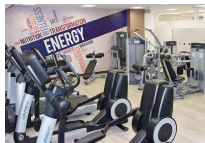
DUNLOP SPORTS CLUB GYM STYLE 24