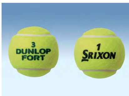
DUNLOP FORT / SRIXON