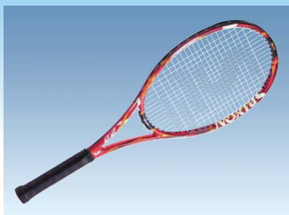
SRIXON REVO CX 2.0