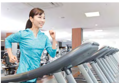
DUNLOP SPORTS CLUB