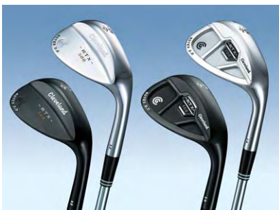
Cleveland 588 RTX 2.0