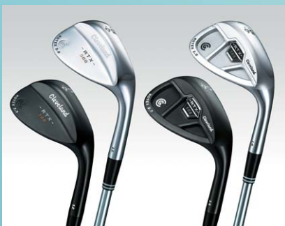
Cleveland 588 RTX 2.0