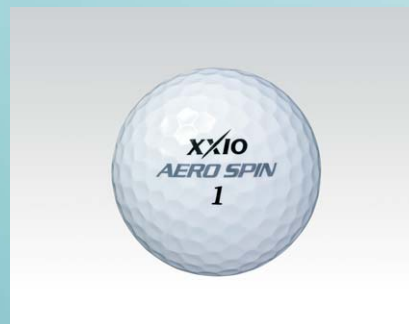
XXIO AERO SPIN