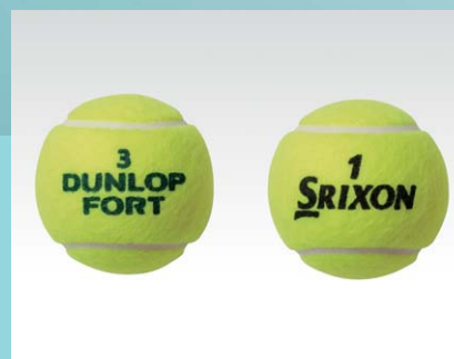
DUNLOP FORT / SRIXON