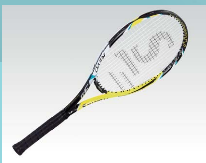
SRIXON REVO V3.0