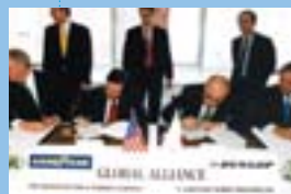
グッドイヤー社との調印式

1999年 米国グッドイヤー社とタイヤ 事業におけるグローバル・ アライアンスを締結