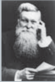
ジョン・ボイド・ダンロップ

1900年 (英国) The Dunlop Rubber Co., Ltd. 設立