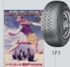
1960年代後半の ラジアルタイヤの ポスター