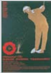
「ダンロップフェニックス トーナメント」第1回大会の ポスター(1974年)