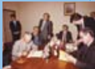
英国ダンロップ社との調印式

1984年 英国・西独・フランスの6工場 およびタイヤ技術中央研究所 の引き取りに調印