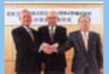
オーツタイヤ(株)との 合併調印式