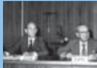
オーツタイヤ(株)と業務提携 を発表