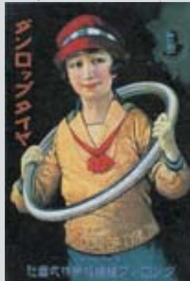
1920年の自転車用 タイヤのポスター