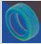
デジタルローリング シミュレーション

1998年 タイヤ設計にスーパー コンピューターでの シミュレーション技術を 応用した「デジタルロー リングシミュレーション (DRS)」技術発表