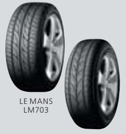
LE MANS LM703

2006年 世界初特殊吸音 スポンジ搭載 「LE MANS(ル・マン) LM703」発売