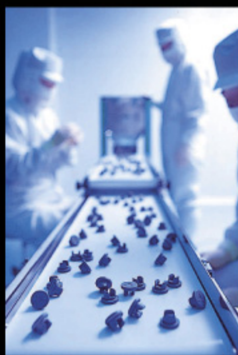
クリーンルームでの製品検査